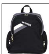
Rucksack Model "Flyn Kid" ohne Hardb.fach