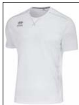
Trainingsshirt kurz Model "Everton"