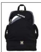
Rucksack Model "Flyn" mit Hardb.fach