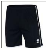
Trainingsshort kurz Model "Bonn"