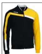
Traineroberteil Model "Andromeda"